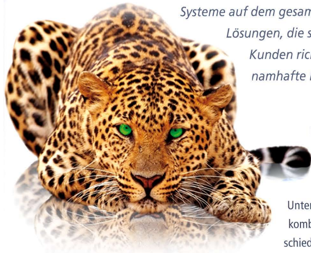
Die RSD S.A. überzeugt mit innovativen Lösungen auf dem Gebiet der Content-Management-Systeme und reagiert schnell auf neue Anforderungen

Die Schweiz ist bekannt für die hervorragende Qualität ihrer Produkte. Nicht nur der Schweizer Käse und die Schokolade werden weit über die Grenzen des Landes hinaus geschätzt, sondern auch die zuverlässigen Uhren und der schweizer Maschinenbau genießen international einen hervorragenden Ruf. Ein weiterer Bereich, in der ein schweizer Unternehmen durch Qualität und Zuverlässigkeit überzeugt, ist die Informationstechnologie. Die RSD S.A. mit Hauptsitz in Genf gehört zu den beiden führenden Unternehmen auf dem Gebiet der Content-Management-Systeme auf dem gesamten Globus. Mit seinen innovativen Lösungen, die sich genau nach den Anforderungen der Kunden richten, konnte das Unternehmen zahlreiche namhafte Kunden von sich überzeugen.